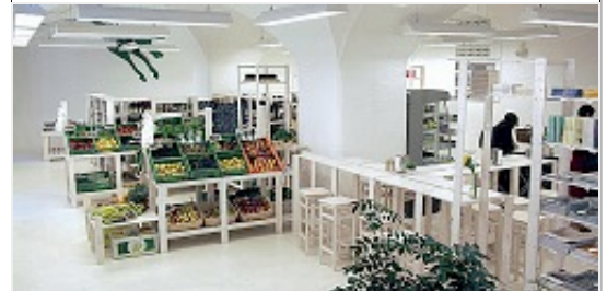
El Dorado für Veganer: Den Supermarkt und das Restaurant 'Zerwerk Deli' in der Münchner Innenstadt stattete Cohen mit hellen, einladenden Holzmöbeln aus.