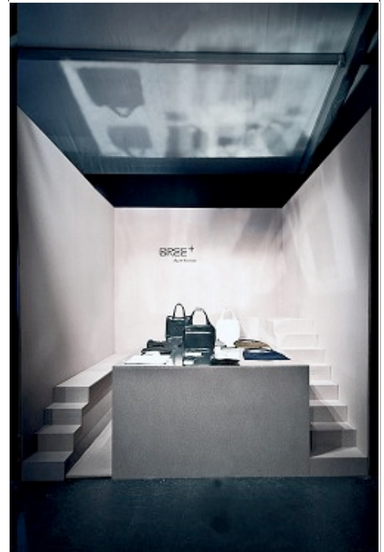
Der Bree-Stand auf der Berlin Fashion Week 2009 zeigt die Taschenkollektion der Designerin Ayzit Bostan.

Namen sind wichtig. Man darf das als Designer nicht unterschätzen. Ein guter Name unterstützt die Aussage des Objekts. Klingt er zu bombastisch, besteht allerdings auch die Möglichkeit, dass er vom Produkt ablenkt. Dafür gibt es zig