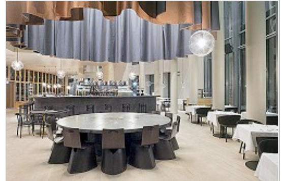
Seit 2008 betreibt Nitzan Cohen ein eigenes Büro im Münchner Glockenbachviertel (oben, links). Vor kurzem eröffnete das von dem Israeli gestaltete 'Table'-Restaurant in Frankfurt am Main.

Nach dem Studium fragte mich Konstantin, ob ich Zeit für ein bestimmtes