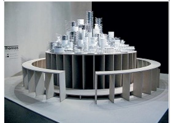
Die Installation 'The knights of the round table', zu sehen auf der Frankfurter Design Annual 2008, schuf Cohen für Rosenthal.